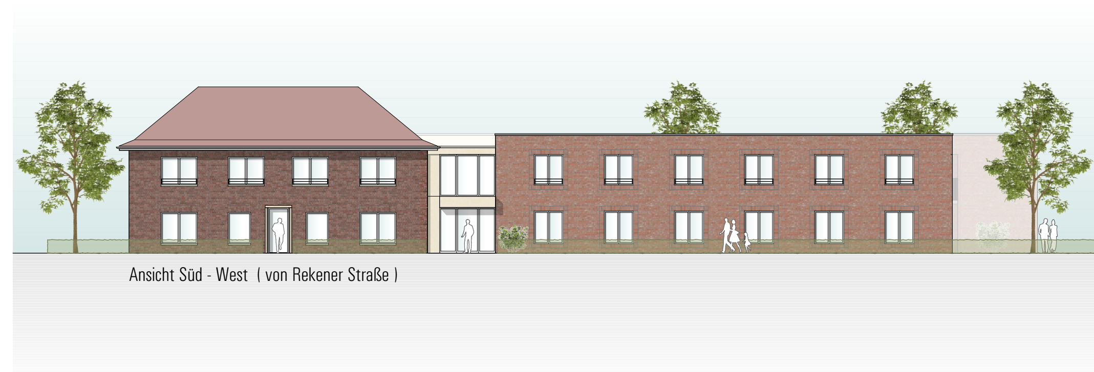
Ansicht Süd - West ( von Rekener Straße )