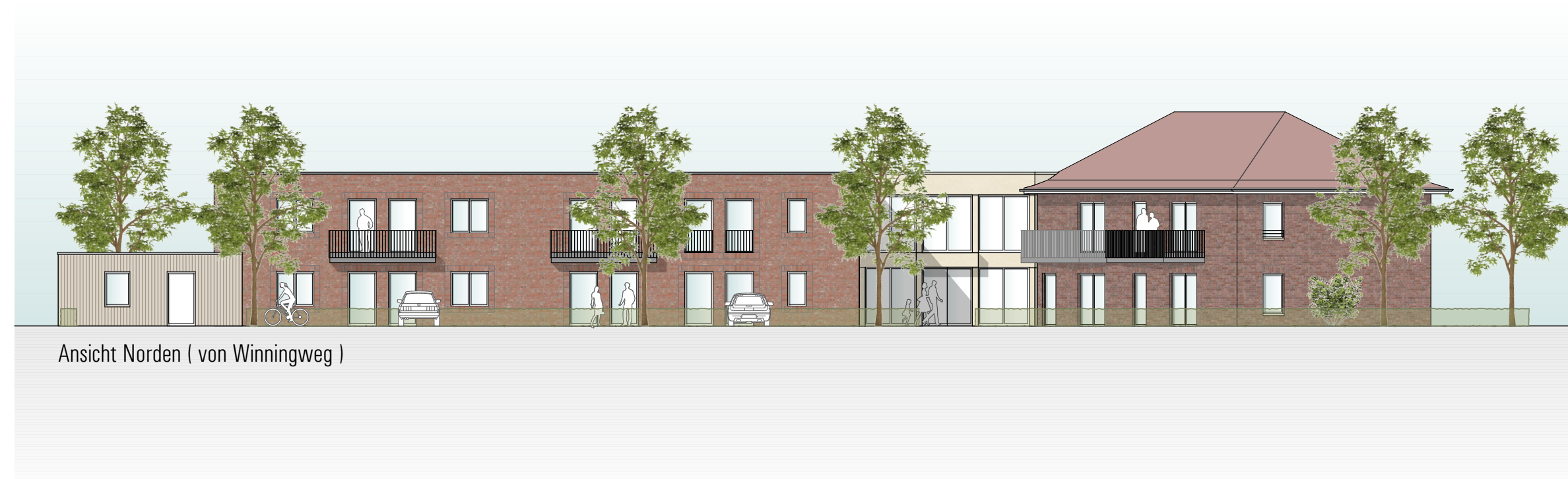
Ansicht Norden ( von Winningweg )

Bauvorhaben Falkenhof Errichtung von 8 Apartments für intensiv ambulant betreutes Wohnen und von 4 Räumen für palliativ- medizinische und pflegerische Betreuung hospizlicher Gäste