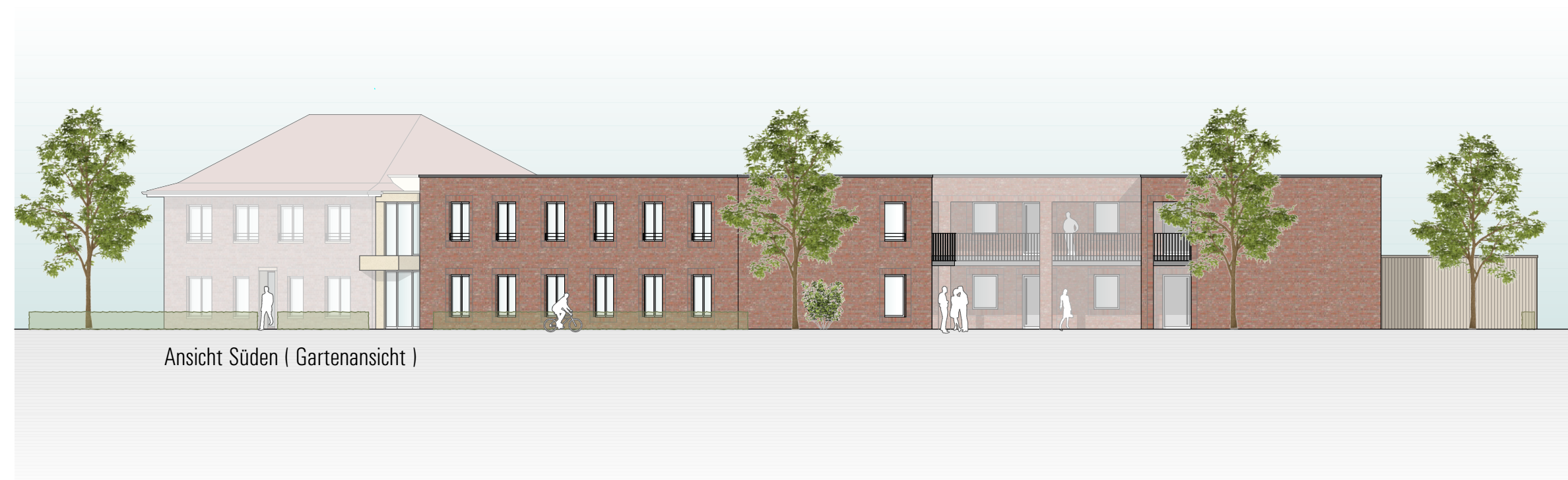
Ansicht Süden ( Gartenansicht )